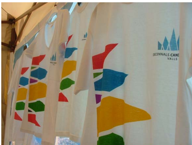
Samarretes dels voluntaris i voluntàries

10 + TU = 11. Amb tu treurem la millor nota